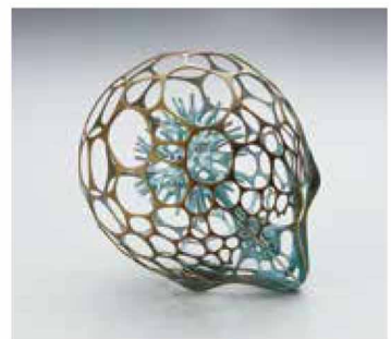
久米圭子 《wonders 080》

Tansuio Award Exhibition: Contemporary Japanese Metalwork