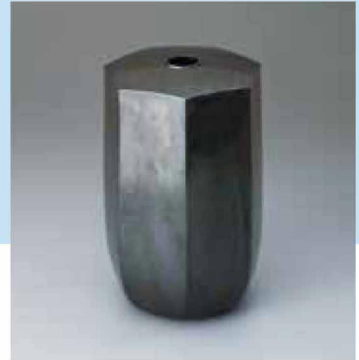
北村 鍾 《鑲銀七角花入》