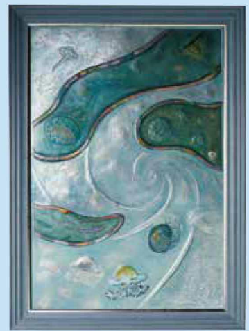
原 典生 《宇宙をおよく》